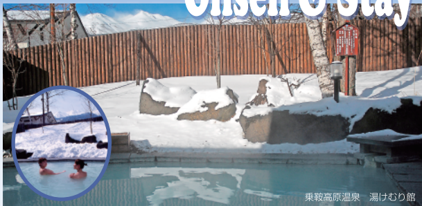
乗鞍高原温泉 湯けむり館